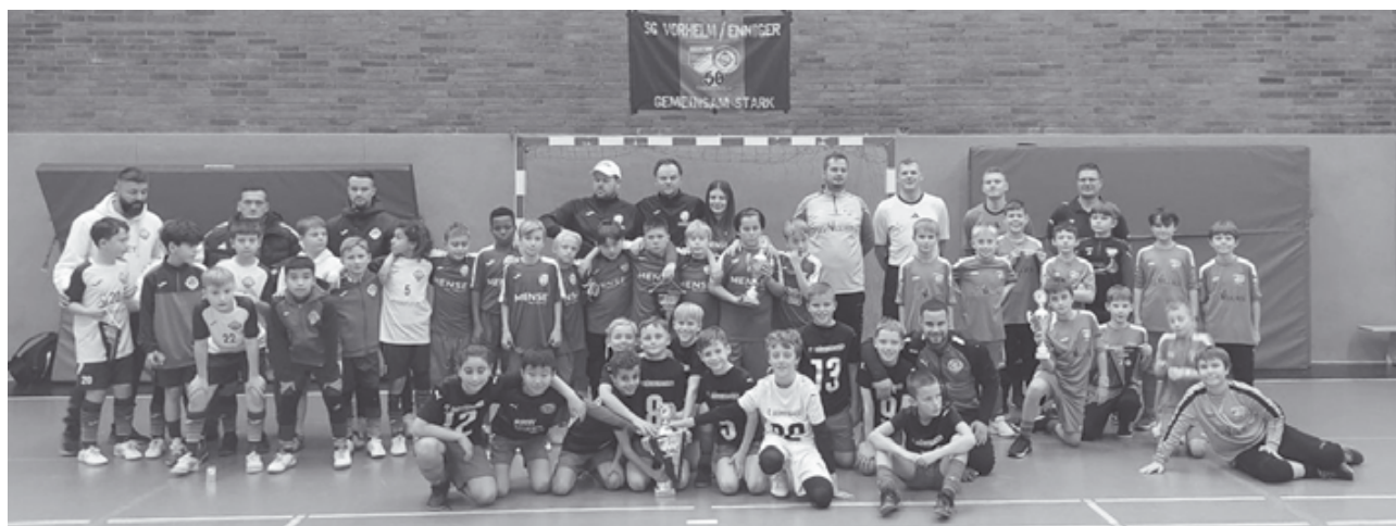
Auf dem Foto sind die Mannschaften der ersten drei Plätze des E-Jgd. Turniers.

Der 2. Vorhelmer Budenzauber war ein voller Erfolg. Ob jung oder alt, Spieler oder Zuschauer – alle hatten sichtlich Spaß. Ein großes Dankeschön an die Organisatoren, Helfer und Fans, die dieses Event möglich gemacht haben. Wir freuen uns schon jetzt auf den nächsten Budenzauber!